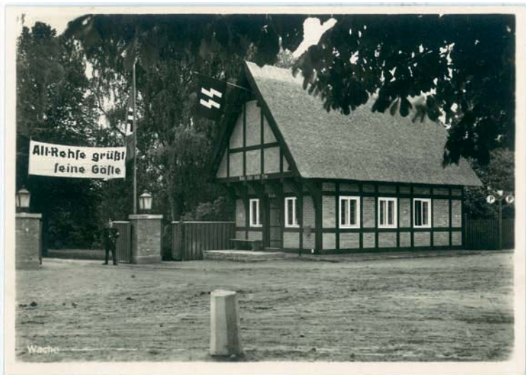
▲ Naar schatting 12.000 artsen, vroedvrouwen en verpleegkundigen genoten een opleiding in Alt-Rehse.