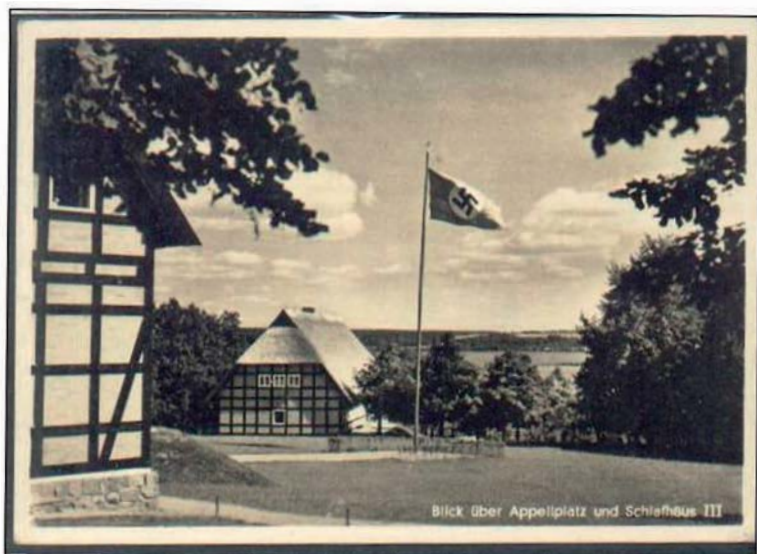
▲ Het hakenkruis wappert boven het idyllisch gelegen opleidingscentrum.