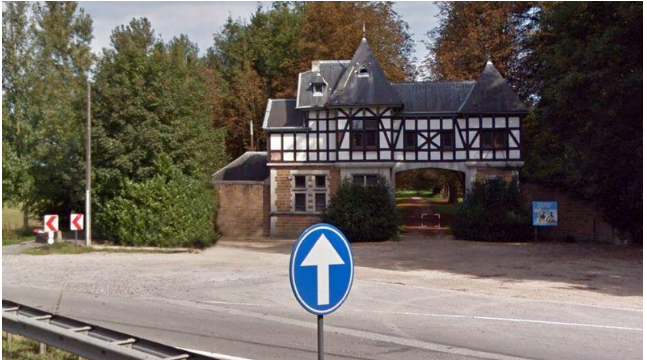
Poortgebouw langsheen de A12

Ontdek het onthutsende verhaal van de arische kinderfabriek van Wolvertem.