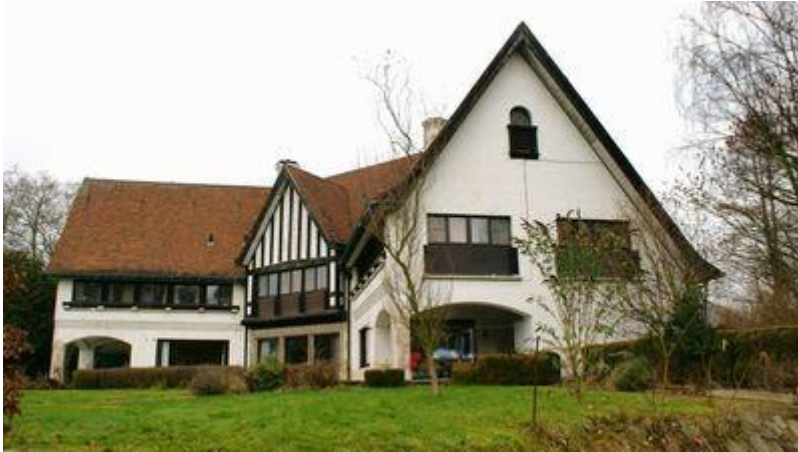
Het huidige tehuis Levedale in Wolvertem