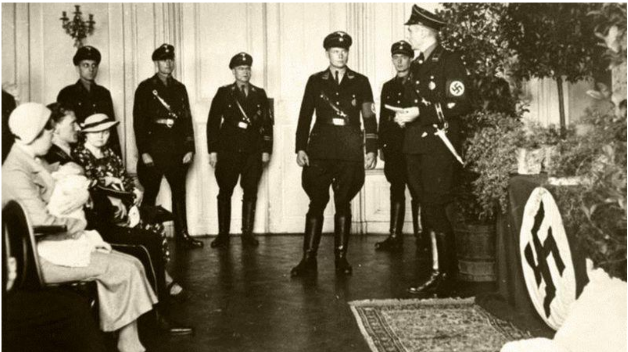
Doopplechtigheid van een Lebensborn-baby

Om te vermijden dat nog meer 'arische' baby's zouden verloren gaan, kwam SS-leider Heinrich Himmler met het idee om speciale kraamklinieken op te zetten, waar jonge vrouwen of ongehuwde moeders ' van goeden bloede ' konden bevallen. Indien de vrouwen na de bevalling ongehuwd bleven, nam de Lebensborn -vereniging de voogdij over de kinderen op zich. De baby's werden 'gedoopt' volgens een nazi-ritueel met Germaanse en pseudo-christelijke elementen. Als doopgeschenk kreeg een Lebensborn -baby een kandelaar mee, vervaardigd door gevangenen van het concentratiekamp Dachau.