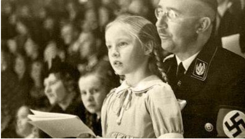
Heinrich Himmler

We moeten dit Mütterheim plaatsen in het Lebensborn -project, een Duits staatsinitiatief met als doel het geboortecijfer te verhogen teneinde een zuiver, arisch ras te scheppen in overeenstemming met de nationaalsocialistische rassenideologie. Na de Eerste Wereldoorlog was er een overschot aan vrouwen in Duitsland. Gevolg was dat veel ongehuwde meisjes bij een zwangerschap abortus pleegden. Op een gegeven moment was het aantal abortussen zelfs hoger dan het geboortecijfer, een demografische ramp voor het 'arische ras'.