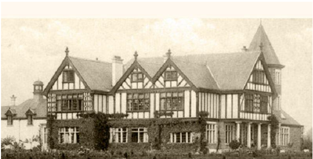
Oude foto van het (nu verdwenen) kasteel Levedale in Wolverthem, hoofgebouw van het Mütterheim

Uit verder onderzoek bleek dat het Mütterheim opgezet was als een afdeling van het Brusselse Brugmann -ziekenhuis, dat door de Duitsers als Kriegslazarett (oorlogshospitaal) werd gebruikt. In augustus 1942 werd het kasteel Levedale in Wolverthem, ook Neromhof genoemd, omgevormd tot een materniteit. De eerste vrouwen werden opgevangen vanaf november van dat jaar in het cottage-kasteel.