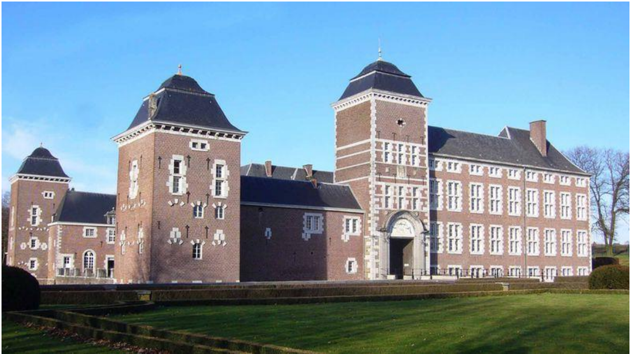
Lebensborn-kasteel van Wégimont

Niemand minder dan Nanna Conti , de moeder van Reichsgesundheitsführer Leonardo Conti , zeg maar de SS-minister van volksgezondheid, bekommerde zich om het Mütterheim in Wolvertem. Zij liet een hoofdvroedvrouw, een Heimleiterin van een Lebensborn uit Noorwegen, overkomen om de kliniek te leiden. Omwille van onenigheid met de Vlaamse vrouwen wordt deze Noorse vroedvrouw later ontslagen.