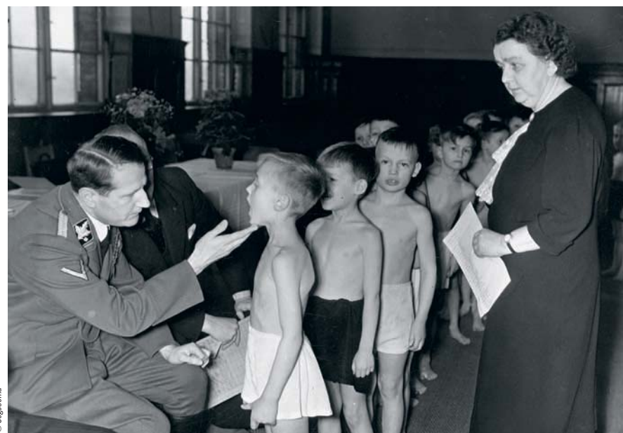
▲ Dr. Leonardo Conti als pediater tijdens een 'preventief onderzoek' in Duitsland. Als 'Reichsgesundheitsführer' van de SS was hij de architect van de 'gezondheidspolitiek' van nazi Duitsland die leidde tot het beruchte T4 programma en de nazi vernietigingspolitiek. Conti werd met de grootste eer ontvangen door de Gentse universiteit.

Toen in 1928 het Kaiser-Wilhelm-Institut für Anthropologie, menschliche Erblehre und Eugenik (KWI) werd opgericht, werd Fischer aangesteld als directeur. Het KWI was een het grootste centrum voor genetica én eugenetica in Duitsland, maar het had geen universitair statuut. Onder leiding van Fischer, en nadien van Freiherr Otmar von Verschuer, groeide het instituut uit tot het epicentrum van de 'wetenschappelijk onderbouwde' raciale politiek.