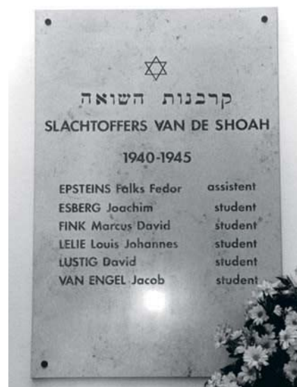
▲ Gedenkplaat voor de slachtoffers van de Shoah, in de Aula van de UGent.

Volgende aflevering: Studenten geneeskunde in oorlogstijd