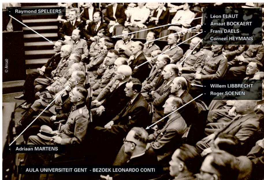
▲ Aandachtige toehoorders tijdens de toespraak van Conti op 23 juni 1941 in de aula van de Gentse universiteit.

Het Rexisme was aanvankelijk geïnspireerd door de filosofie van Charles Maurras, Frans schrijver en nationalistisch politicus die na de oorlog tot levenslang veroordeeld werd wegens collaboratie. In tegenstelling tot het Vlaams nationalisme was Rex eerder Belgicistisch gezind, om nadien te verzanden in het delirium van het Groot-Bourgondische Rijk