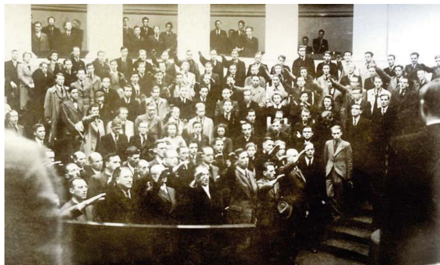
▲ De collaboratie was diep geworteld in Vlaamse medische kringen. Hier een beeld van de Hitlergroet tijdens het Dietsch Studentencongres in april 1941 in de Gentse aula, waar ook tal van professoren geneeskunde aanwezig waren.