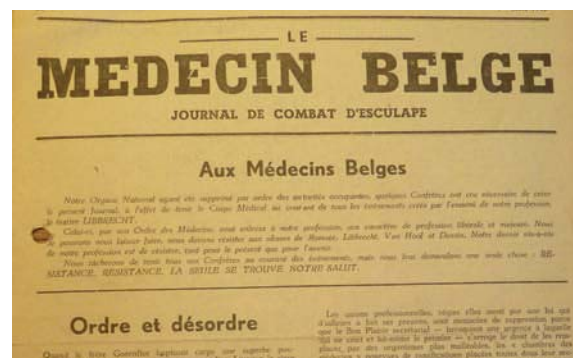
▲ Een onuitgegeven document: Le Médecin Belge riep op 1 mei 1942 op tot verzet tegen de Oorlogsorde.