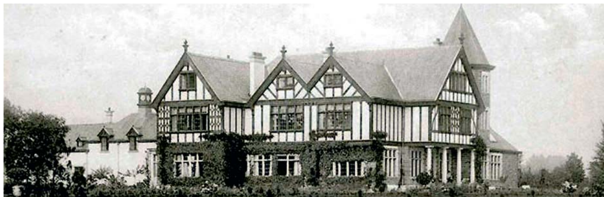
▲ Het Mütterheim in Wolvertem was de voorloper van de Lebensborn in Wégimont.

de mort en cas d'avortement d'un fœtus aryen pour atteinte à la force vitale du peuple allemand. De l'autre, l'interdiction de procréer dans les ghettos, la stérilisation massive des femmes juives dans les camps, l'incitation à la contraception, à l'avortement, à la stérilisation volontaire dans les territoires de l'Est."