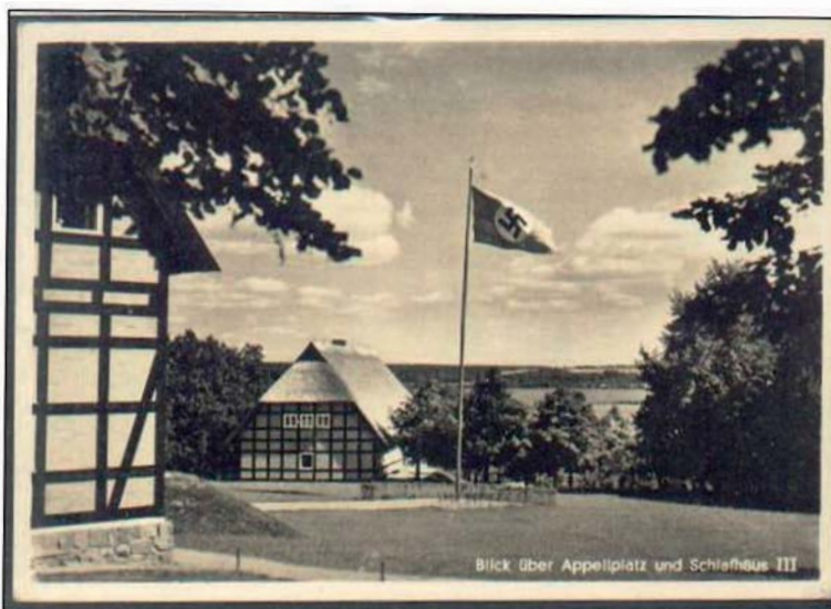
▲ Het hakenkruis wappert boven het idyllisch gelegen opleidingscentrum.