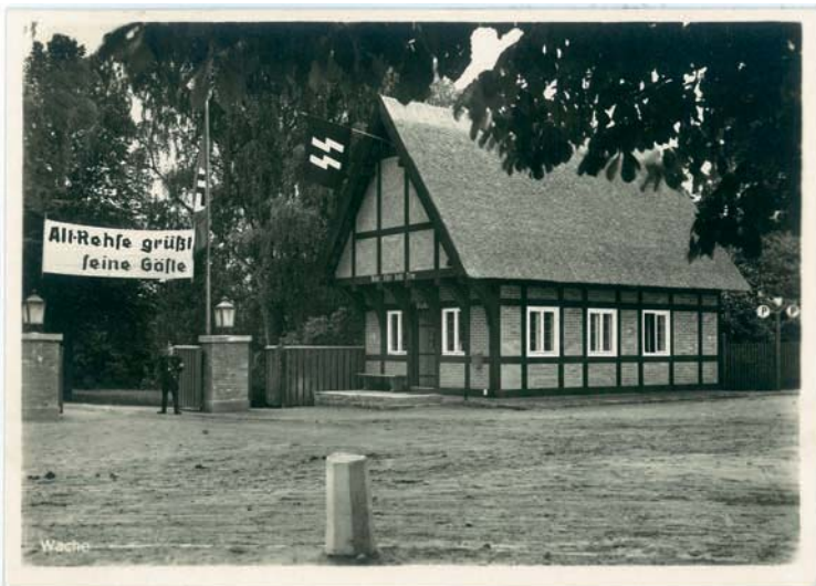
▲ Naar schatting 12.000 artsen, vroedvrouwen en verpleegkundigen genoten een opleiding in Alt-Rehse.